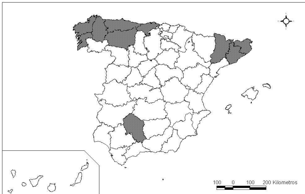
PROVINCIAS COM MÁS DE 185 MILLONES DE LITROS DE LECHE DE VACA PRODUCIDOS (1998)